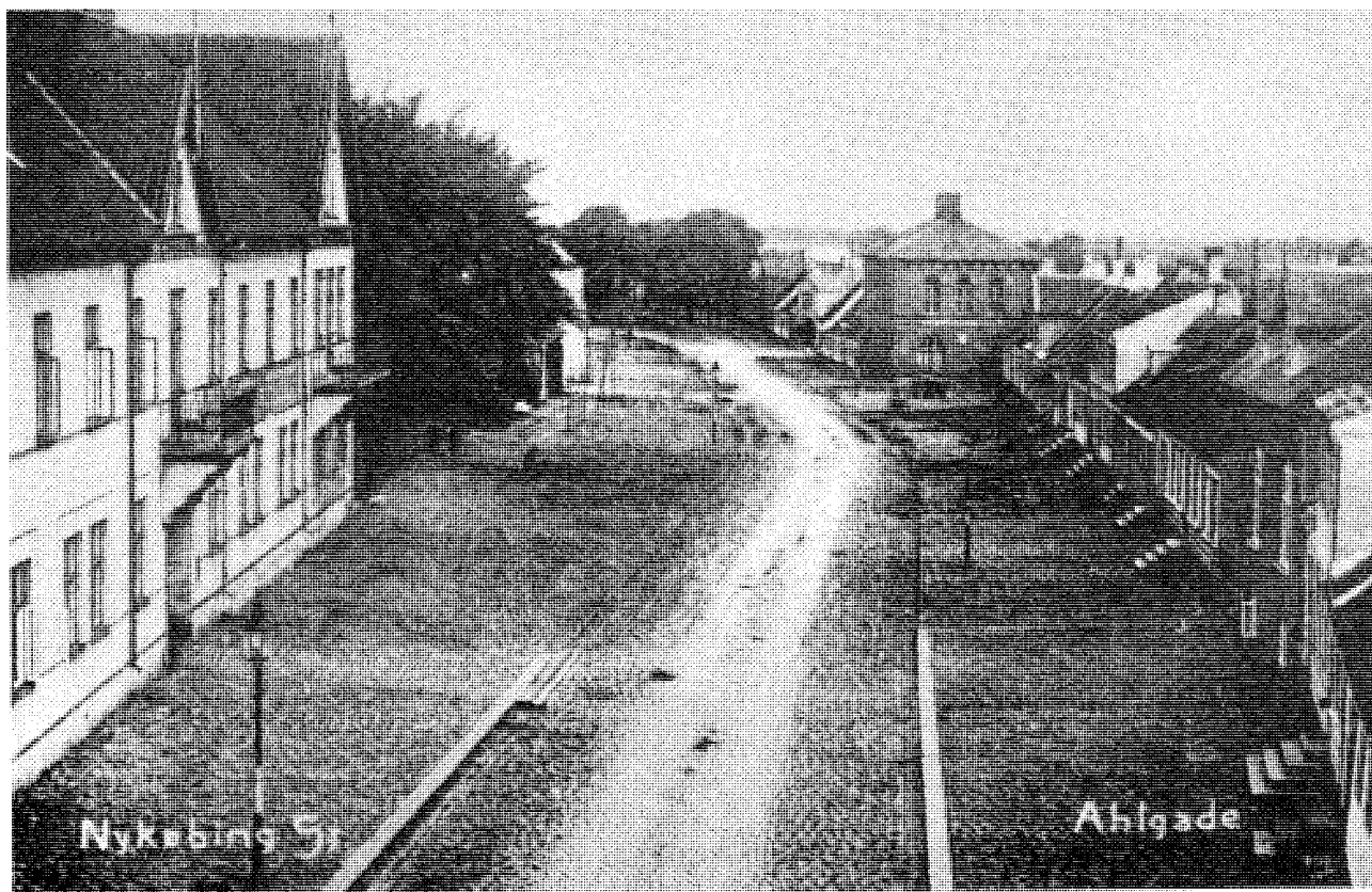
Billedet viser den østlige ende af Ahlgade, som dengang blev stavet med et "h". Både gade og fortov er brolagte ca. 1920. Til venstre ses "Phønix", og i baggrunden ser man Teknisk Skole. Bemærk gadebelysningen med gaslygter. Ved Teknisk Skole begynder Lindeallé.