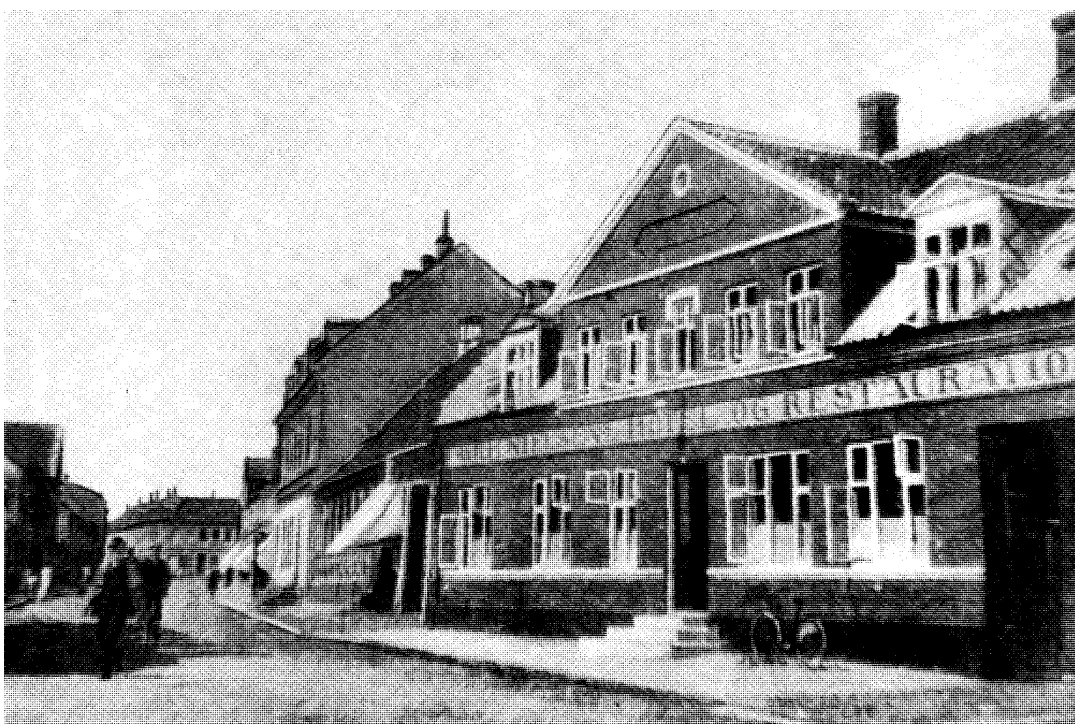
"Vilhelm Nielsens Hotel". Det senere Hotel "Odsherred"

Efter mødet festmiddag på hotel "Phønix" med mange taler for orden og forening.