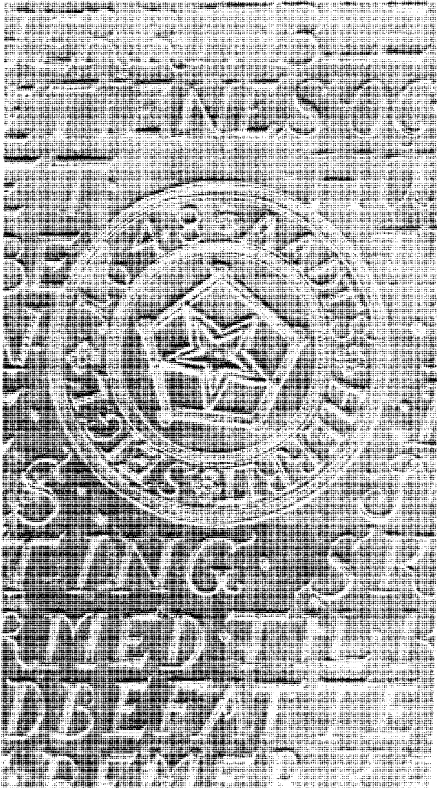
Det senere Odsherred Segl. Midterpartiet var Dragsholm Segl, der igen var komponeret på grundlag af Odsherreds Segl fra 1610